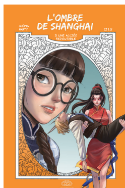
TOME 3 : une alliée redoutable