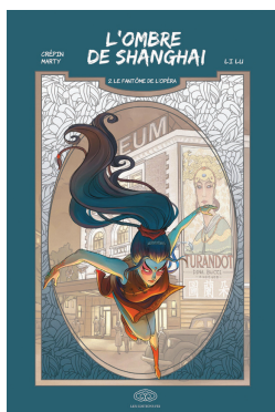
TOME 2 : le fantôme de l'opéra