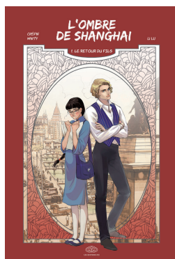
TOME 1 : le retour du fils